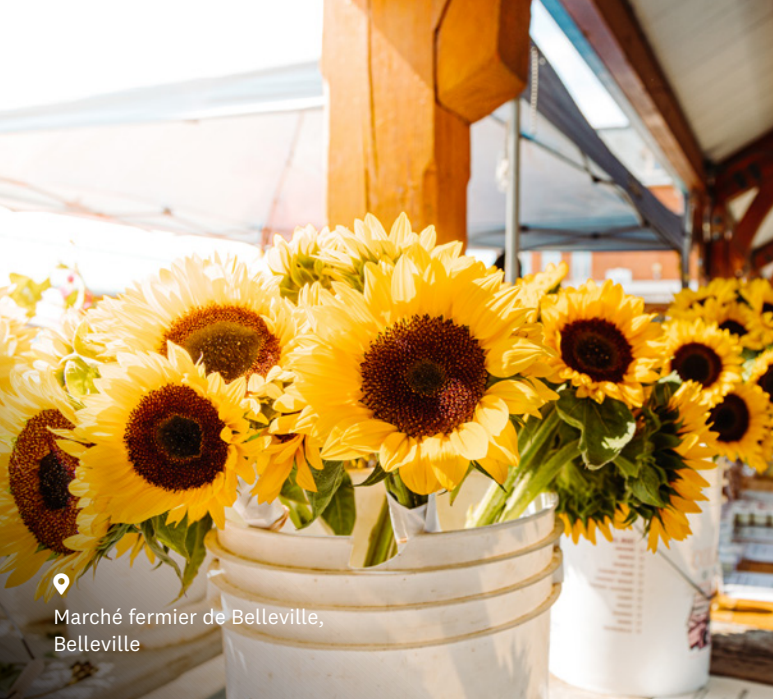
Marché fermier de Belleville, Belleville