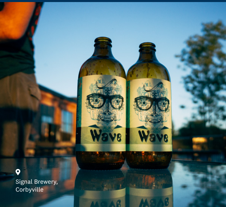
Signal Brewery, Corbyville